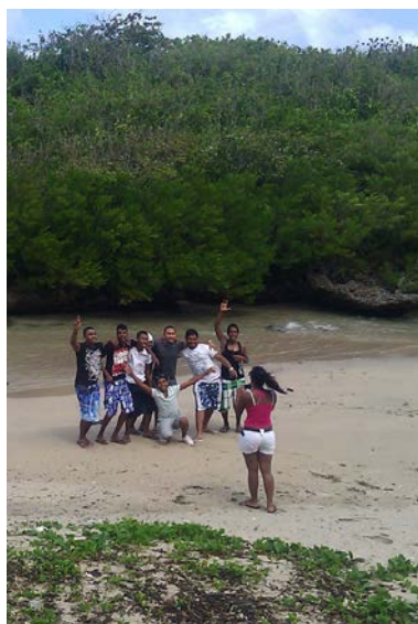
Excursion dans le sud de l'île

Ce dernier objectif s'est imposé suite au projet de la troupe d'animer des ateliers dans différentes paroisses de l'île. Et il a été satisfait au-delà de nos espérances car tous les participants ont pu pratiquer l'animation avec succès, alors qu'à l'origine la co-animation ne concernait que les trois animateurs responsables. Et pour chacun, le fait d'animer ne serait-ce